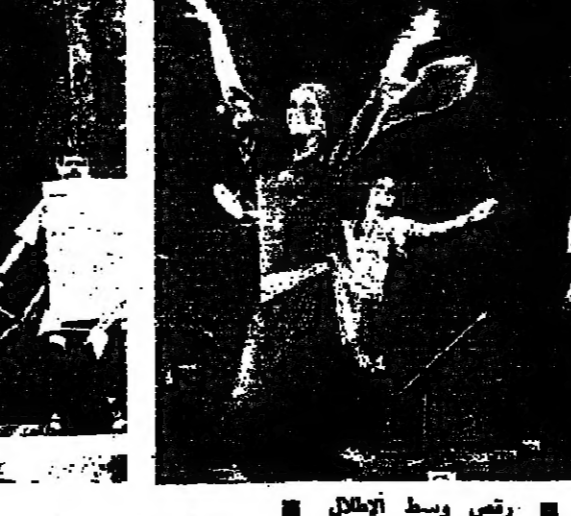
رضي وسط إطلال